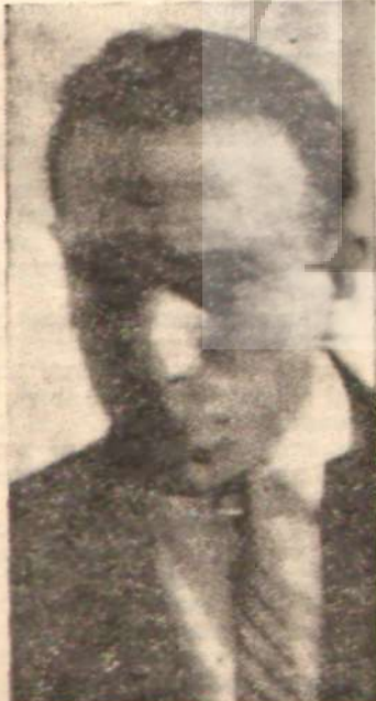
ALPASLAN TÜRKES Açık konuşmalı.

Afom çağına ulaşma iddiaları ile ortaya çıkıp en aşağı cinsten kahve dedikoduları ve pis iftiralarla vakit geçiren bir parti lideri var. Ta lât Aydemir ile önce pazarlık edip sonra uyusamayınca, onu ihbar eden bu zat, Radyo da «bir dergi ve dernek» diyerek YÖN'e ve Sosyalist Kültür Derneğine, kendi seviye sine uygun biçimde saldırmış tir. CKMP Genel Başkan Yardımcısı Numan Esin'in Sosyalist Kültür Derneğinde bir konferans vermesi üzerine, Genel Başkan Türkeş, Meclis kürsüsünde de YÖN'e ve Derneğe saldırmıştı. O zaman buna gülüp geçmiştik. Şimdi saldırılarını daha da geliştirerek, Radyoyu iftira larına âlet etmektedir. Atom çağındaki bir kahve dedikodu, ducusu, TIP'e de bir başka türlü camur attıktan sonra şöyle demiştir: «Türkiye'de kurulmuş bir çok komünist teşkilâtı vardır. Bu teşkilâtlardan birisi tam Moskova'ya bağlı bir komünizmin peşinde koşmakta ve memleket çapında geniş siyasi faaliyet göstermektedir. Diğerleri ise, bir dergi etrafında ve bazı derneklerinde top