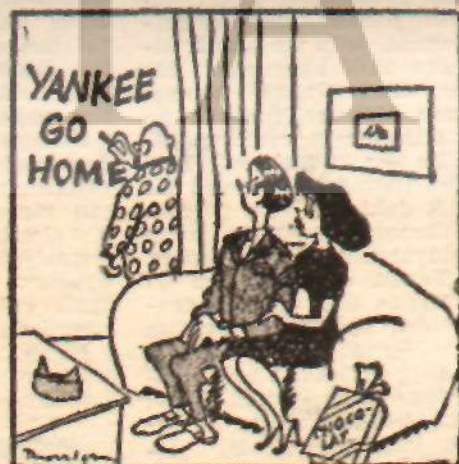
AMERİKANYAN MİZAH İstenmeyen Nişanlı