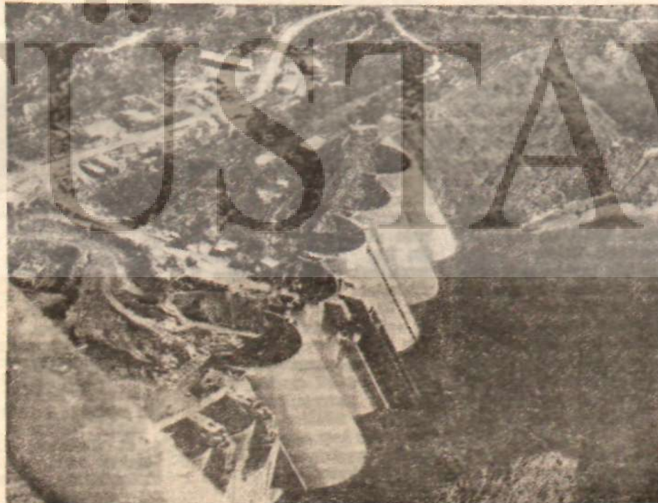
Tunus'ta Mecerra Barajı

Bu Fransızca konuşan gençler, sık sık kullandıkları «Arap» (onu, «Ağap» şeklinde telâffuz ediyorlar) sözcüğü ile halkı kastediyorlar. Sûk'a geldiğimiz zaman: «Kartiye Ağaba geldik» dediler. Şelebi Arap nasyonalizmine kızıyor. Bu Ağap nasyonalizmini Avrupalıların icat ettiğine inanıyor. Çünkü Avrupalıların